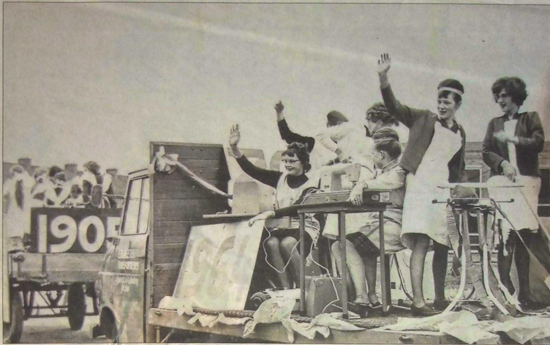
De vrouwelijke pioniers van meisjesonderwijs werden zelfs belachelijk gemaakt door vrouwen, die het recht ontkenen op vrijheid van geestesontwikkeling.