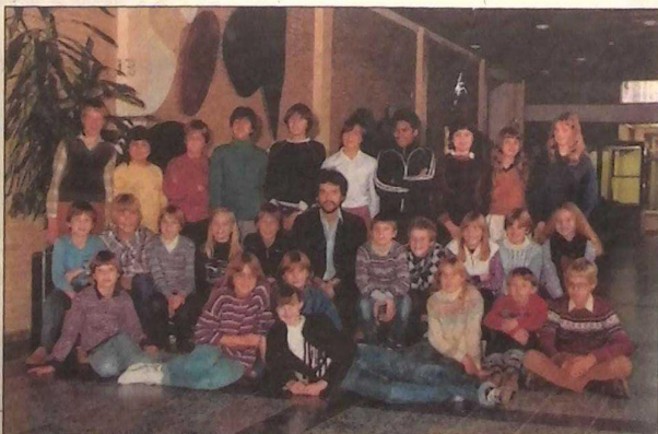
Bijgaande klassenfoto laat zien dat midden jaren tachtig de compositie van dit kunstwerk anders was. Wellicht is het ook niet meer geheel compleet.